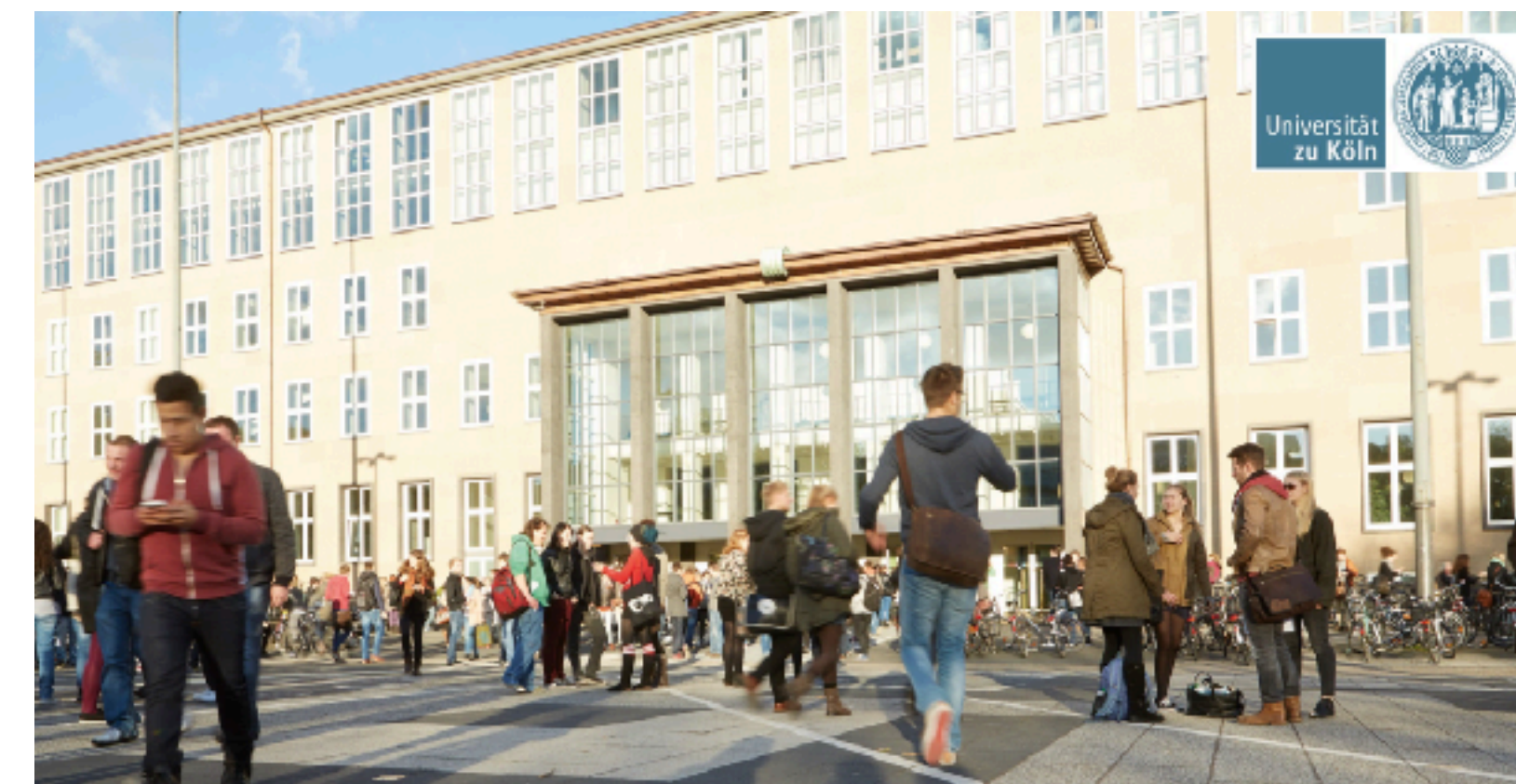
Преподавание и обучение в Кельнском университете