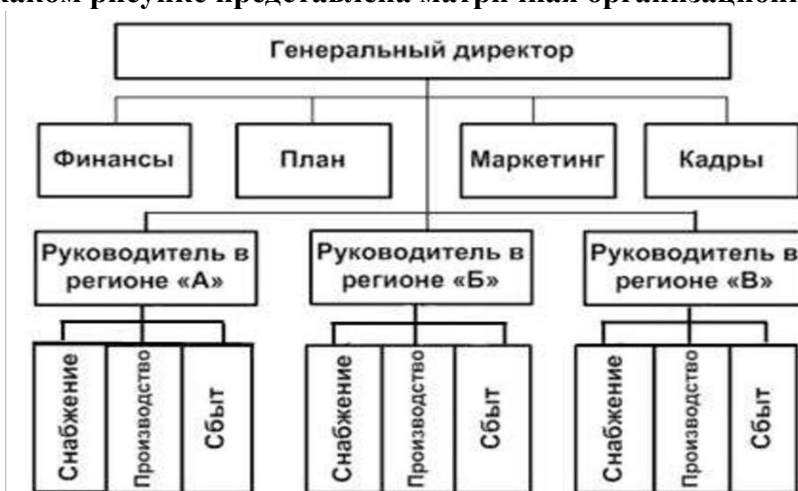
(?) Рисунок 1