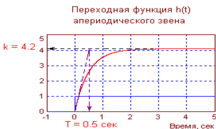
Рис. 2.3. Переходная функция аперриодического звена

Написание обозначений единиц физических величин. При написании числовых значений величин используют обозначения единиц буквами или специальными знаками, например, 5 А; 8,2 Н; 12 Вт; 120°; 15'; 28%. Между последней цифрой числа и обозначением единицы физической величины следует оставлять пробел, исключение составляют знаки, поднятые над строкой. Не допускается перенос обозначения единиц на следующую строку.