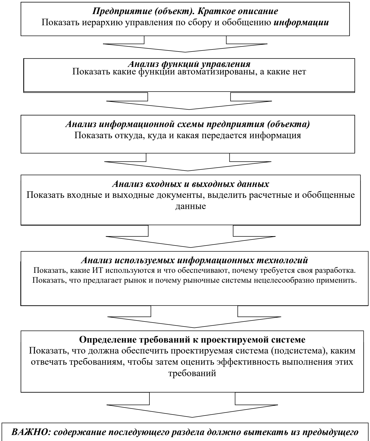
Схема изложения материала по аналитике (по первой главе)