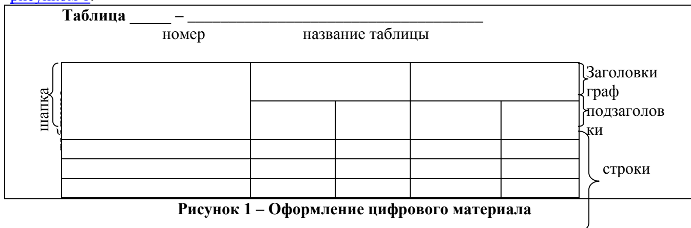
Рисунок 1 – Оформление цифрового материала

Цифровой материал, как правило, оформляют в виде таблиц в соответствии с рисунком 1 .