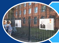
Фото-выставка «Помним! Чтим! Гордимся!»

Встречи с ветеранами ВОВ, представителями спецподразделения «Альфа»